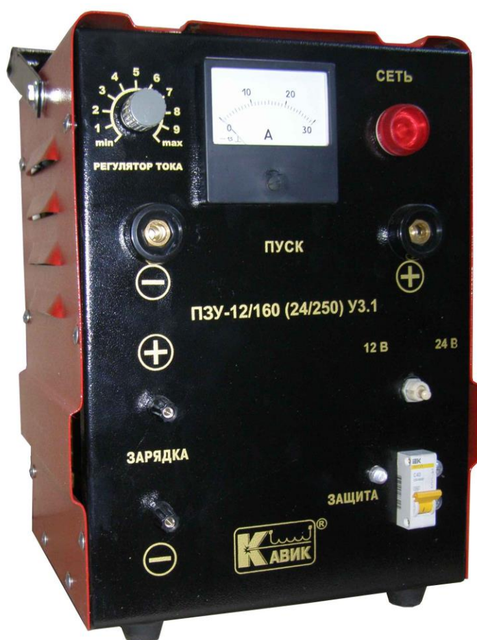
Рис.1. Общий вид ПЗУ

Устройство не рассчитаны на применение в особых условиях (пыль, пары, газы, и т.п.) и на установку во взрывоопасных помещениях.