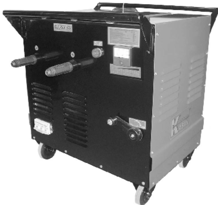
Рис 1. Общий вид выпрямителя

1.4. Не допускается использование выпрямителя для работы в среде насыщенной пылью, во взрывоопасной среде, а также в среде, содержащей едкие пары и газы, разрушающие металлы и изоляцию.