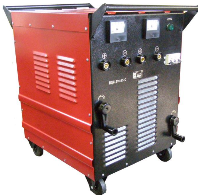
Рис.1 Общий вид выпрямителя

1.9. Класс защиты трансформаторов 1 по ГОСТ 12.2.007.0-75.