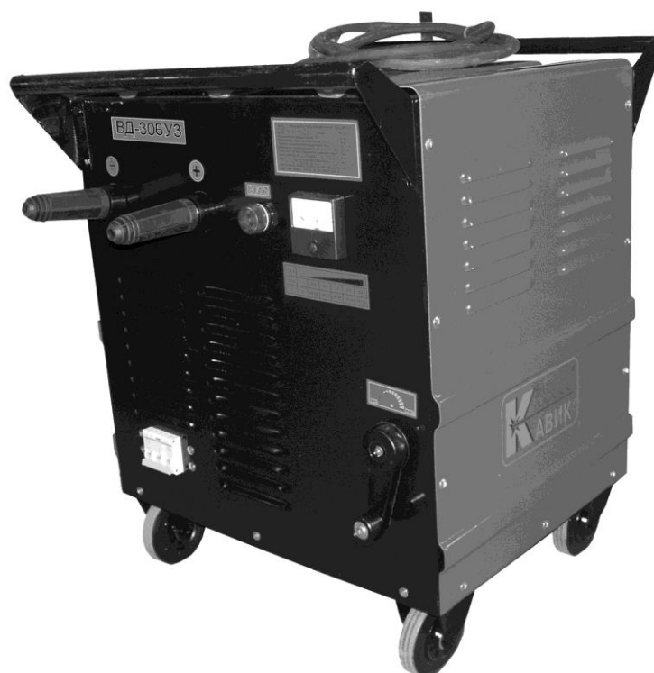
Рис 1. Общий вид выпрямителя

1.9. Охлаждение- воздушно-принудительное.