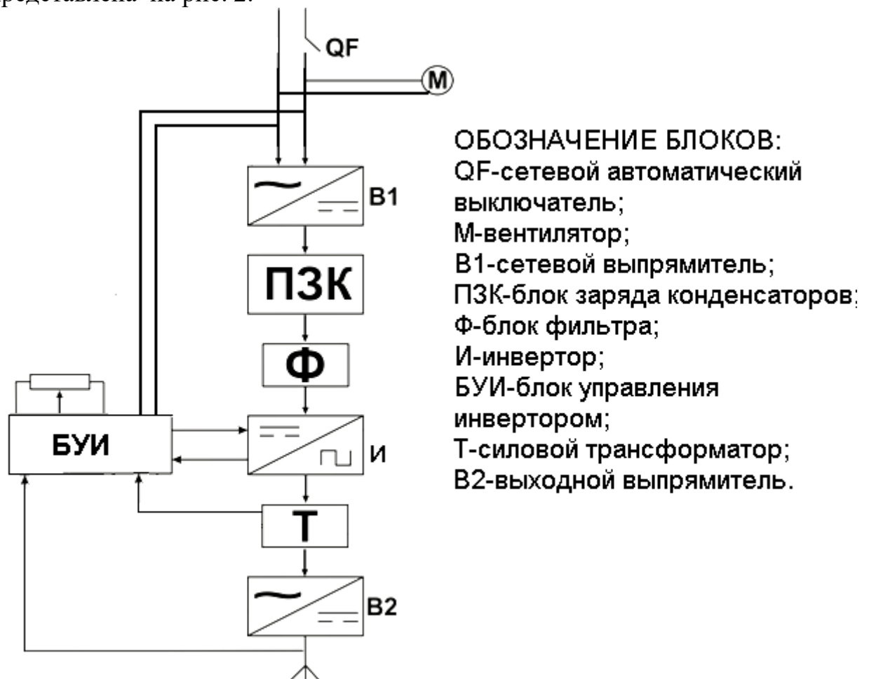
Рис.2 Обобщенная структурная схема выпрямителя.

Обобщенная структурная блок-схема выпрямителей типа «ВД-200ИМ УЗ» представлена на рис. 2.