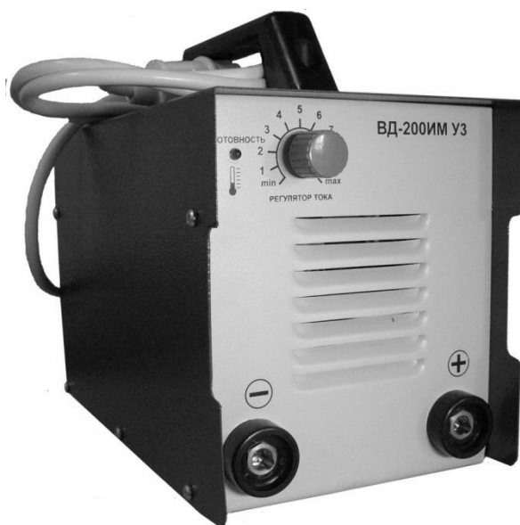
Рис 1. Внешний вид выпрямителя сварочного инверторного типа (рис.1)

1.6. Выпрямитель обеспечивает повышенную безопасность за счет ограниченного до 62В напряжения холостого хода. При этом сохраняются сварочные свойства аналогичные аппаратам с напряжением холостого хода 90В.