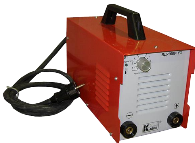
Рис 1. Внешний вид выпрямителя сварочного инверторного типа (рис.1)

1.6. Выпрямитель обеспечивает повышенную безопасность за счет ограниченного до 62В напряжения холостого хода. При этом сохраняются сварочные свойства аналогичные аппаратам с напряжением холостого хода 90В.