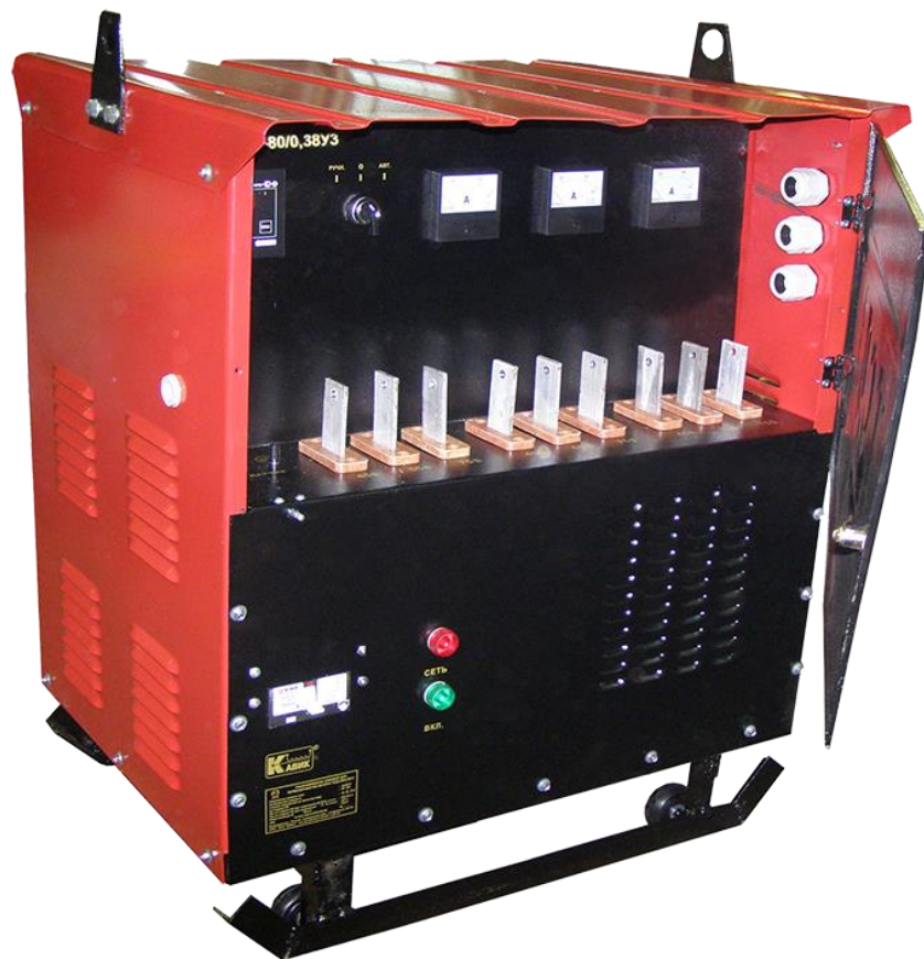
Рис.1 Общий вид трансформатора

1.6 Изделие предназначено для подключения только к промышленным сетям. Подключение к сетям бытовых помещений не допускается